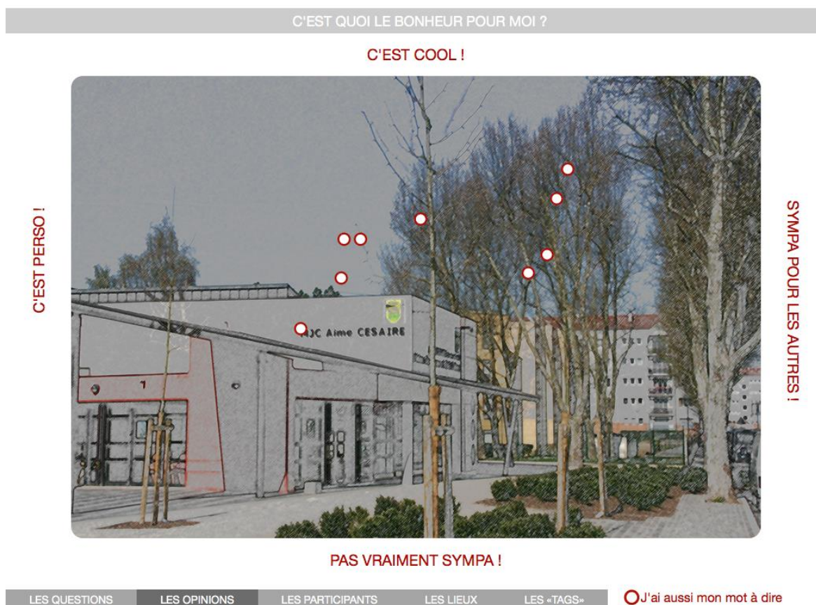
Illustration : à Viry, l'animateur du média citoyen local a animé un atelier avec des enfants âgés de 7 à 12 ans environ sur la thématique du bonheur.

Ici, les participants sont amenés à se positionner. Ils commentent les vidéos et votent. Chaque commentaire et chaque vote contribuent à une moyenne qui déplace les opinions exprimées vers le haut de la mosaïque ou vers le bas, vers la droite ou vers la gauche (tout dépend du nombre d'axes choisis).